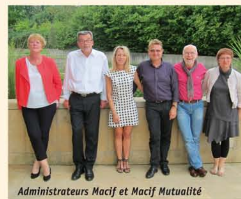
Administrateurs Macif et Macif Mutualité

mutualistes pour représenter les sociétaires et adhérents : nous devons assurer la cohérence de l'activité, le renouvellement de notre sensibilité.